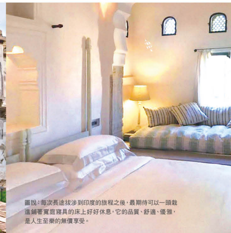
圖說：每次長途跋涉到印度的旅程之後，最期待可以一頭栽進鋪著寬庭寢具的床上好好休息，它的品質、舒適、優雅，是人生至樂的無價享受。

「第一眼就愛上它了。不過，作為住宅太大，就考慮把它變成小小的 Heritage hotel。」這幢超過 220 歲的古堡位於著名的歷史地區 Shekhawati，本身就是富於底蘊的文化資產。兩三百年前，當地富貴崇尚打造豪宅，宅內專為女人建造的閨房稱為 haveli，有特殊設計的二樓陽台可供婦女窺視外界，而立面壁畫更是一絕，通常是主人為了炫富，競出高價聘請藝術家手繪而成，演變為當地建築美學一大特徵。後來隨著社會變遷大量棄置，遺留下來的 haveli 壁畫漸漸成為文化旅遊焦點，「世上最大露天藝廊」的美稱不脛而走。