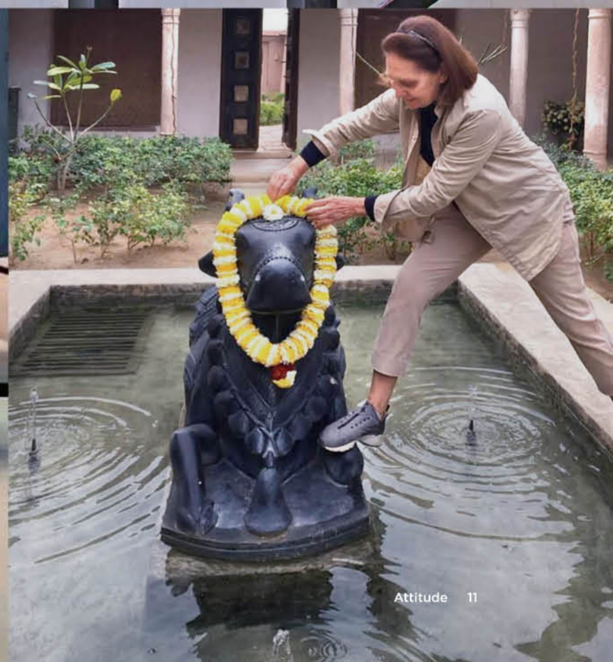
圖說：如今古堡花木扶疏、水光激盪，大大小小的庭園竟有四、五座。專業服務之外，更想提供旅客身心靈的安定和寧靜，這才是真正的奢華。